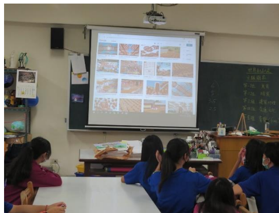
新埔記憶牆面畫社課程內容